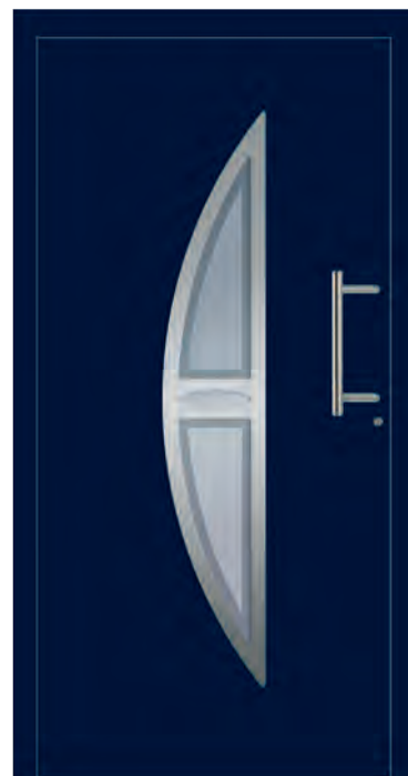
DUBAI - Aluminium-Haustür einseitig flügelüberdeckend außen, Rahmen in Edelstahloptik außen, Glas: 3-fach WSG Ug 0,7, Sandstrahlmotiv: K334, Farbe: ähnl. RAL 5011 Stahlblau