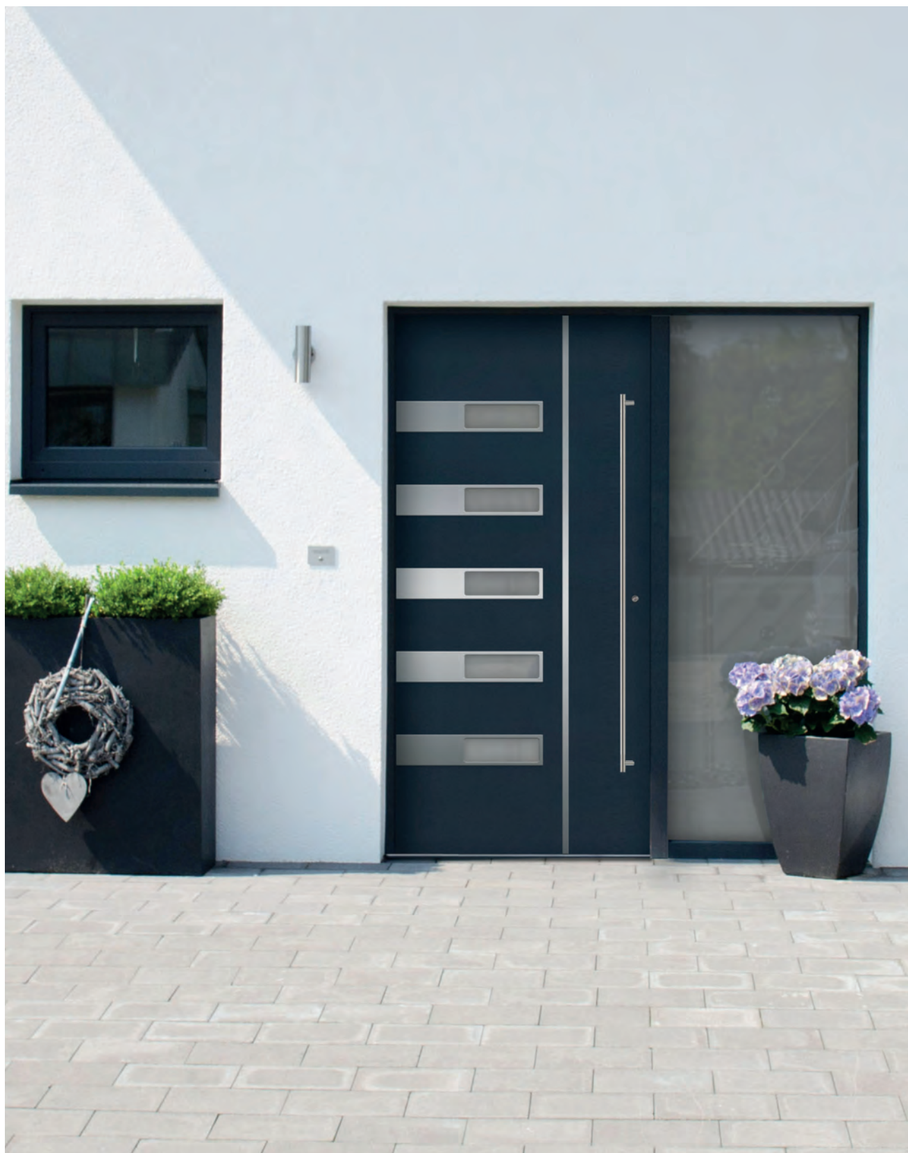
WASHINGTON - Aluminium-Haustür einseitig flügelüberdeckend außen, Applikationen in Edelstahloptik außen, Glas: 3-fach WSG Ug 0,7, Farbe: ähnl. RAL 7016 Anthrazitgrau, Stoßgriff 01806 auf schrägen Stützen (1400 mm) optional