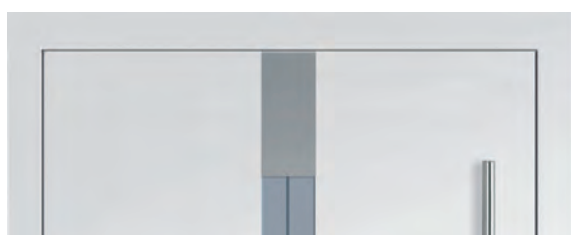
Außenansicht: Beidseitig flügelüberdeckende Ausführung

* PL April 2020 = Preisliste mit Stand vom April 2020