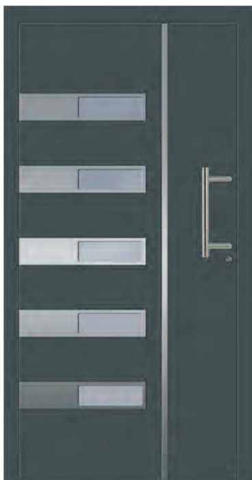
WASHINGTON - Aluminium-Haustür, einseitig flügelüberdeckend außen, Applikationen in Edelstahloptik außen, Glas: 3-fach WSG Ug 0,7, Farbe: ähnl. RAL 7012 Basaltgrau