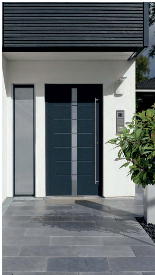
KOPENHAGEN - Aluminium-Haustür