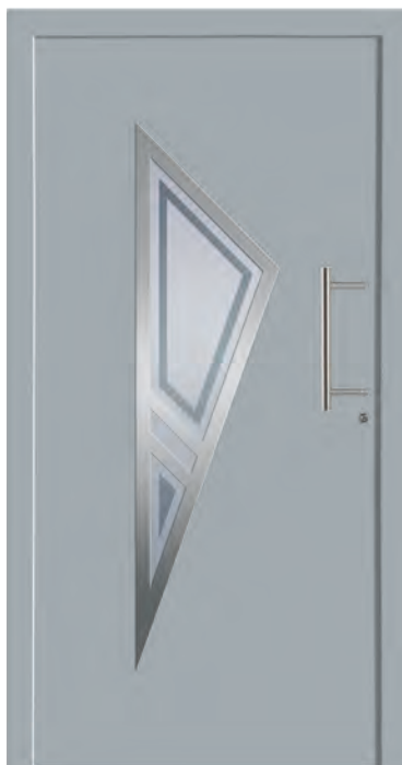
PARIS - Aluminium-Haustür einseitig flügelüberdeckend außen, Rahmen in Edelstahloptik außen, Glas: 3-fach WSG Ug 0,7, Sandstrahlmotiv: Y356, Farbe: ähnl. RAL 7001 Silbergrau