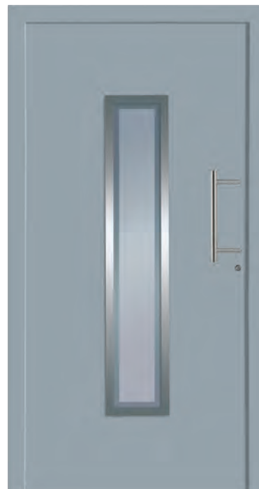
LONDON - Aluminium-Haustür einseitig flügelüberdeckend außen, Rahmen in Edelstahloptik außen, Glas: 3-fach WSG Ug 0,7, Sandstrahlmotiv: Y1816, Farbe: ähnl. RAL 7001 Silbergrau