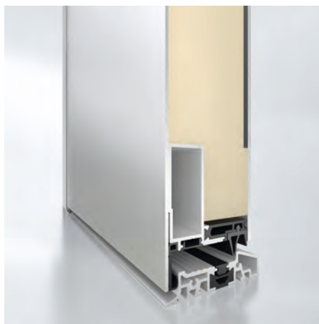
Beidseitig flügelüberdeckend (Mehrpreis) Innenansicht