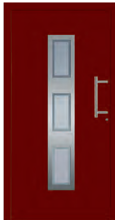
MADRID - Aluminium-Haustür einseitig flügelüberdeckend außen, Rahmen in Edelstahloptik außen, Glas: 3-fach WSG Ug 0,7, Sandstrahlmotiv: K333, Farbe: ähnl. RAL 3004 Purpurrot