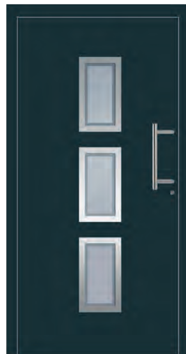
MOSKAU - Aluminium-Haustür einseitig flügelüberdeckend außen, Rahmen in Edelstahloptik außen, Glas: 3-fach WSG Ug 0,7, Sandstrahlmotiv: Y1800, Farbe: ähnl. RAL 7016 Anthrazitgrau