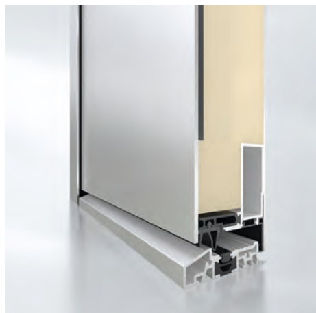
Beidseitig flügelüberdeckend (Mehrpreis) Außenansicht