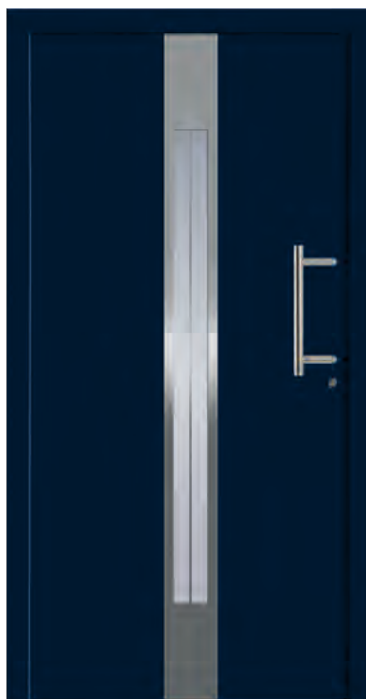
PRAG - Aluminium-Haustür einseitig flügelüberdeckend außen, Applikation in Edelstahloptik außen, Rahmen in Edelstahloptik innen, Glas: 3-fach WSG Ug 0,7, Sandstrahlmotiv: Y1822, Farbe: ähnl. RAL 5011 Stahlblau