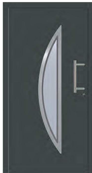
WIEN - Aluminium-Haustür einseitig flügelüberdeckend außen, Rahmen in Edelstahloptik außen, Glas: 3-fach WSG Ug 0,7, Sandstrahlmotiv: Y899, Farbe: ähnl. RAL 7012 Basaltgrau