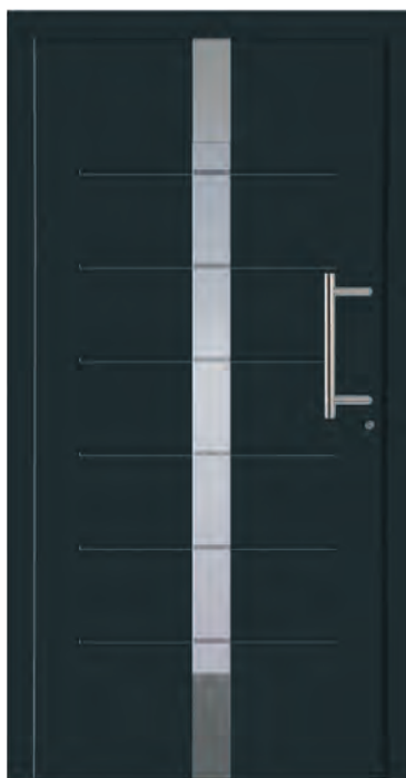
KOPENHAGEN - Aluminium-Haustür, einseitig flügelüberdeckend außen, Applikationen in Edelstahloptik und Nuten außen, Rahmen in Edelstahloptik innen, Sandstrahlmotiv: Y887, Glas: 3-fach WSG Ug 0,7, Farbe: ähnl. RAL 7016 Anthrazitgrau