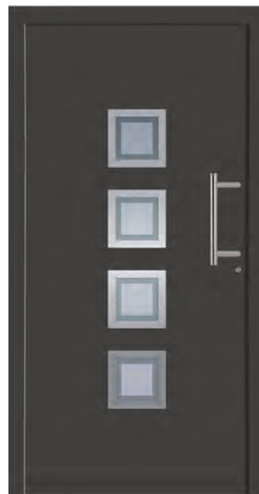
BRASILIA - Aluminium-Haustür einseitig flügelüberdeckend außen, Rahmen in Edelstahloptik außen, Glas: 3-fach WSG Ug 0,7, Sandstrahlmotiv: K423, Farbe: ähnl. DB 703 Eisenglimmer