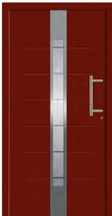
LISSABON - Aluminium-Haustür einseitig flügelüberdeckend außen, Applikationen in Edelstahloptik und Nuten außen, Rahmen in Edelstahloptik innen, Sandstrahlmotiv: Y887, Glas: 3-fach WSG Ug 0,7, Farbe: ähnl. RAL 3004 Purpurrot