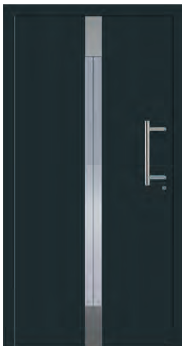
TOKIO - Aluminium-Haustür einseitig flügelüberdeckend außen, Applikationen in Edelstahl außen, Edelstahlrahmen innen, Glas: 3-fach WSG Ug 0,7, Sandstrahlmotiv: Y947, Farbe: ähnl. RAL 7016 Anthrazitgrau