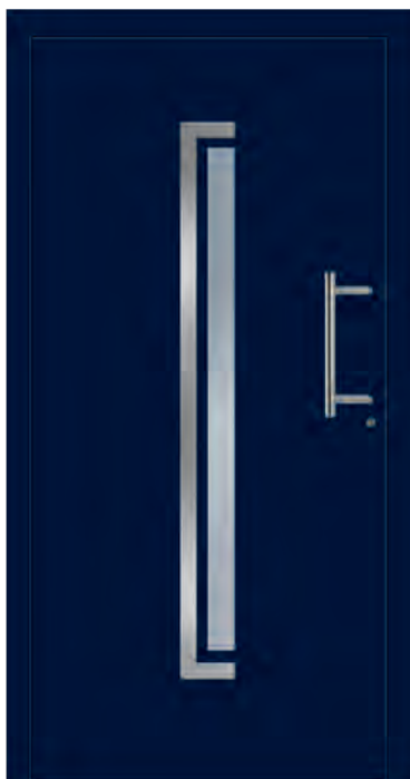
KAPSTADT - Aluminium-Haustür einseitig flügelüberdeckend außen, Applikation in Edelstahloptik außen, Rahmen in Edelstahloptik innen, Glas: 3-fach WSG Ug 0,7, Farbe: ähnl. RAL 5011 Stahlblau