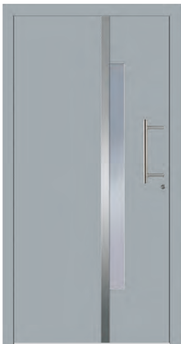
BERLIN - Aluminium-Haustür einseitig flügelüberdeckend außen, Applikation in Edelstahloptik außen, Rahmen in Edelstahloptik innen, Glas: 3-fach WSG Ug 0,7, Farbe: ähnl. RAL 7001 Silbergrau