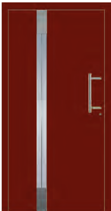
OSLO - Aluminium-Haustür einseitig flügelüberdeckend außen, Applikationen in Edelstahloptik außen, Edelstahlrahmen innen, Glas: 3-fach WSG Ug 0,7, Sandstrahlmotiv: Y947, Farbe: ähnl. RAL 3004 Purpurrot