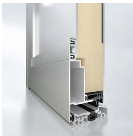
Einseitig flügelüberdeckend Innenansicht