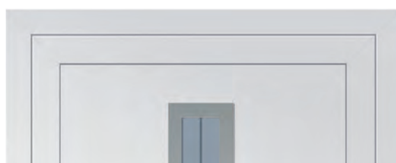
Innenansicht: Einseitig flügelüberdeckende Ausführung