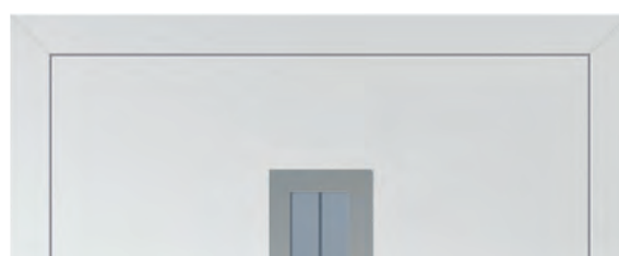
Innenansicht: Beidseitig flügelüberdeckende Ausführung