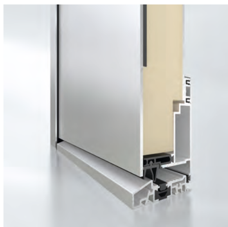
Einseitig flügelüberdeckend Außenansicht