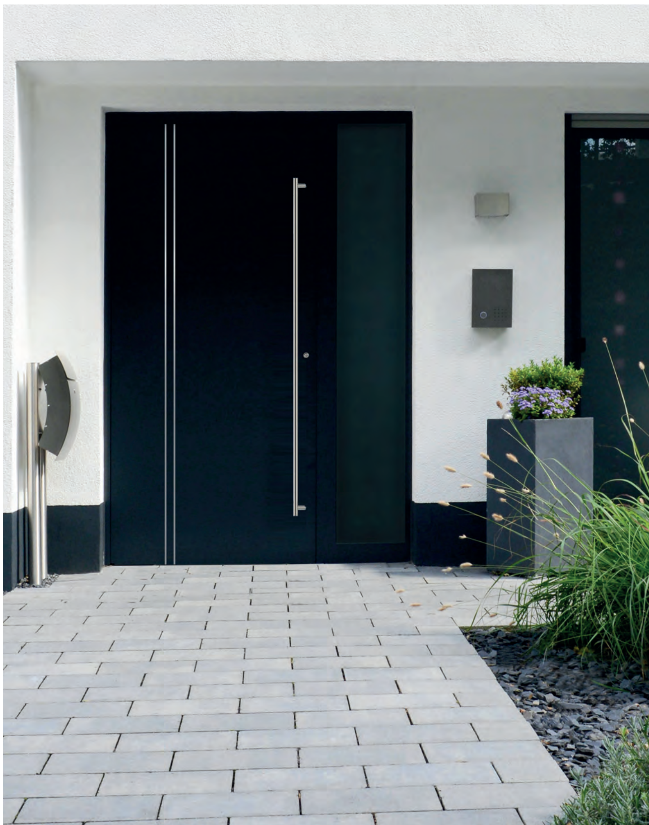
BRÜSSEL - Aluminium-Haustür einseitig flügelüberdeckend außen, aufgesetzte Applikationen in Edelstahloptik außen, Farbe: ähnl. DB 703 Eisenglimmer, Stoßgriff 01807 auf schrägen Stützen (1800 mm) als Zusatzoption