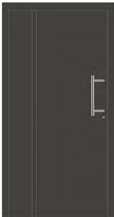
STOCKHOLM - Aluminium-Haustür, einseitig flügelüberdeckend außen, Flachnuten außen, Farbe: ähnl. DB 703 Eisenglimmer