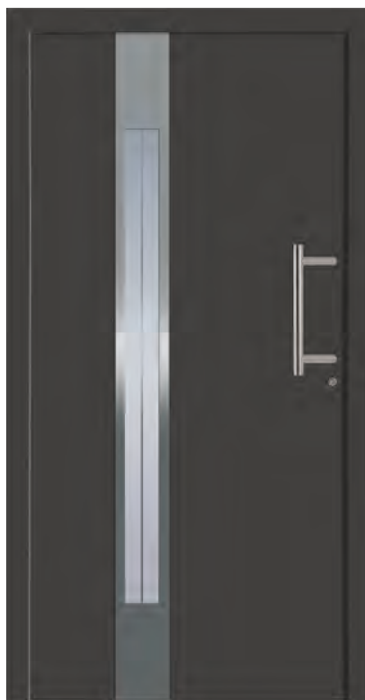
PEKING - Aluminium-Haustür einseitig flügelüberdeckend außen, Applikation in Edelstahloptik außen, Rahmen in Edelstahloptik innen, Glas: 3-fach WSG Ug 0,7, Sandstrahlmotiv: Y1822, Farbe: ähnl. DB 703 Eisenglimmer