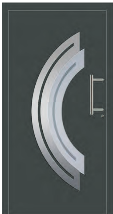
ROM - Aluminium-Haustür einseitig flügelüberdeckend außen, Applikation in Edelstahloptik außen, Rahmen in Edelstahloptik innen, Glas: 3-fach WSG Ug 0,7, Sandstrahlmotiv: Y933, Farbe: ähnl. RAL 7012 Basaltgrau