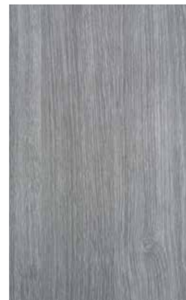
sheffield oak concrete