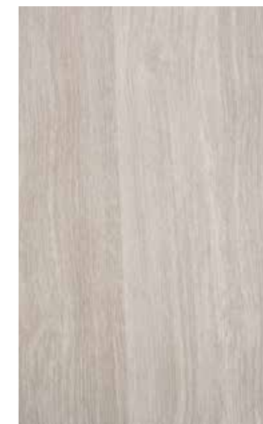
sheffield oak alpine