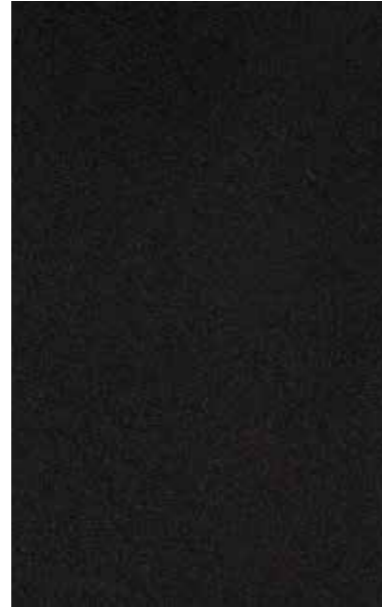
aludec jet black