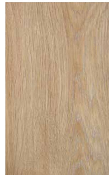
turner oak malt