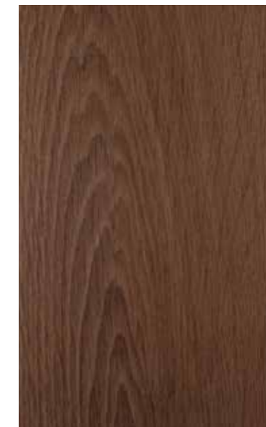
turner oak toffee