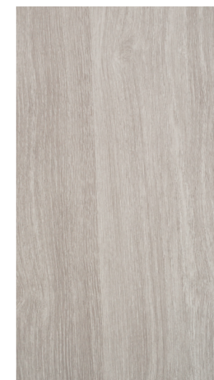
sheffield oak alpine