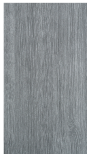
sheffield oak concrete