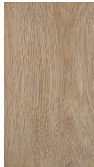
turner oak malt