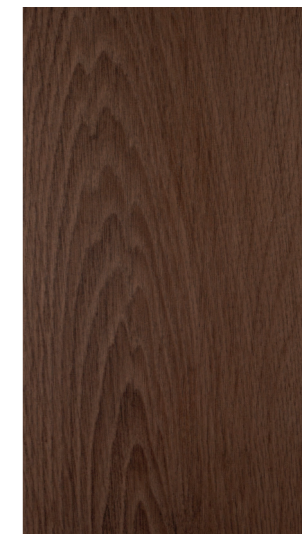
turner oak toffee