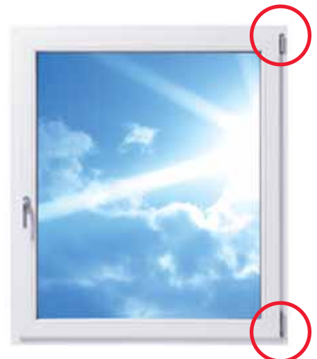
Ein herkömmliches Fenster mit sichtbaren Bändern