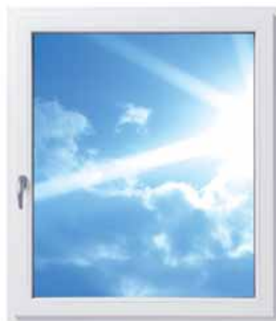
Ein Fenster mit Roto NT Designo und völlig verdeckt liegenden Bändern

Und obendrein spart man Zeit bei der Fensterreinigung. Roto hat diesen verdeckt liegenden Beschlag mit seiner eleganten, mattsilbernen Oberfläche neu entwickelt. Für schöne Holz- und Kunststoffenster, die hohen Komfort, exklusives Design und zahlreiche Gestaltungsmöglichkeiten bieten.